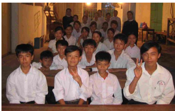
collégiens à Vinh Luu